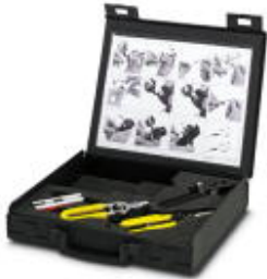
Tool set for PCF assembly, for 200/230 \mu\text{m} , 50/200/230 \mu\text{m} , and 62.5/200/230 \mu\text{m} PCF fibers

Please be informed that the data shown in this PDF Document is generated from our Online Catalog. Please find the complete data in the user's documentation. Our General Terms of Use for Downloads are valid ( http://phoenixcontact.com/download )