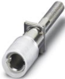
Female test connector, Color: red

Please be informed that the data shown in this PDF Document is generated from our Online Catalog. Please find the complete data in the user's documentation. Our General Terms of Use for Downloads are valid ( http://download.phoenixcontact.com )