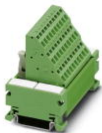
VARIOFACE COMPACT LINE, sensor module for the connection of 8 p-n-p sensors, for assembly on DIN rail NS 35/7.5, spring-cage connection

Please be informed that the data shown in this PDF Document is generated from our Online Catalog. Please find the complete data in the user's documentation. Our General Terms of Use for Downloads are valid ( http://phoenixcontact.com/download )