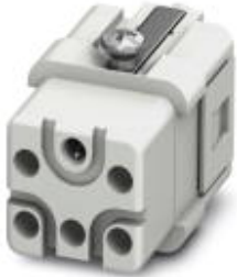
HEAVYCON socket insert, Q5 series, 5-pos., crimp connection

Please be informed that the data shown in this PDF Document is generated from our Online Catalog. Please find the complete data in the user's documentation. Our General Terms of Use for Downloads are valid ( http://phoenixcontact.com/download )