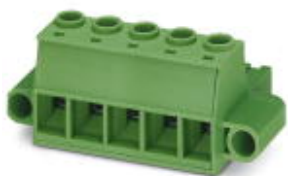
The figure shows a 5-pos. version of the product

PCB connector, nominal current: 41 A, number of positions: 2, pitch: 10.16 mm, connection method: Screw connection with tension sleeve, color: green, contact surface: Silver