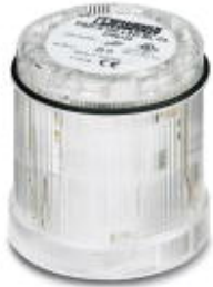
LED blinking light element, 24 V AC/DC, clear

Please be informed that the data shown in this PDF Document is generated from our Online Catalog. Please find the complete data in the user's documentation. Our General Terms of Use for Downloads are valid ( http://phoenixcontact.com/download )