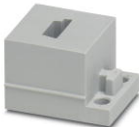
Small, slotted cable sleeves suitable for one AS-i cable (R), material: SEBS, version: right

Please be informed that the data shown in this PDF Document is generated from our Online Catalog. Please find the complete data in the user's documentation. Our General Terms of Use for Downloads are valid ( http://download.phoenixcontact.com )