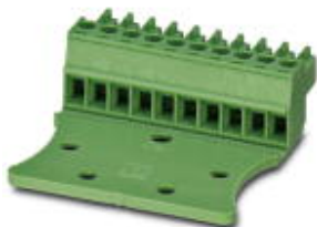
The figure shows the 10-position version

Please be informed that the data shown in this PDF Document is generated from our Online Catalog. Please find the complete data in the user's documentation. Our General Terms of Use for Downloads are valid ( http://phoenixcontact.com/download )