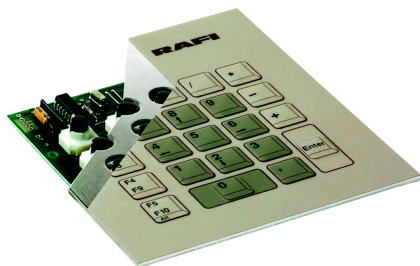
RF 15 R high, with 3 mm LED, green