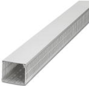
Cable duct, white, comprising upper part and mounting base, width: 25 mm, height: 60 mm, length: 2000 mm

Please be informed that the data shown in this PDF Document is generated from our Online Catalog. Please find the complete data in the user's documentation. Our General Terms of Use for Downloads are valid ( http://phoenixcontact.com/download )