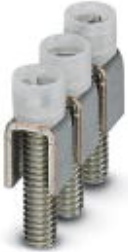
Fixed bridge, Number of positions: 3, Color: silver

Please be informed that the data shown in this PDF Document is generated from our Online Catalog. Please find the complete data in the user's documentation. Our General Terms of Use for Downloads are valid ( http://download.phoenixcontact.com )