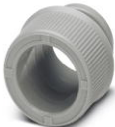
End sleeves as cable protection

Please be informed that the data shown in this PDF Document is generated from our Online Catalog. Please find the complete data in the user's documentation. Our General Terms of Use for Downloads are valid ( http://phoenixcontact.com/download )