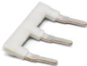
Insertion bridge, Pitch: 10 mm, Number of positions: 3, Color: gray

Please be informed that the data shown in this PDF Document is generated from our Online Catalog. Please find the complete data in the user's documentation. Our General Terms of Use for Downloads are valid ( http://phoenixcontact.com/download )