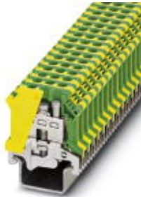
Ground terminal block with screw connection, cross section: 0.5 - 6 mm 2 , AWG: 20 - 8, width: 8.2 mm, color: green-yellow

Please be informed that the data shown in this PDF Document is generated from our Online Catalog. Please find the complete data in the user's documentation. Our General Terms of Use for Downloads are valid ( http://download.phoenixcontact.com )