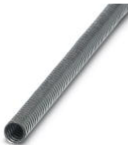
Protective hose in stainless steel

Please be informed that the data shown in this PDF Document is generated from our Online Catalog. Please find the complete data in the user's documentation. Our General Terms of Use for Downloads are valid ( http://phoenixcontact.com/download )