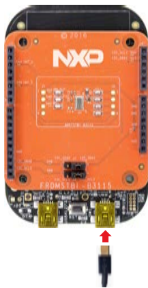
Figure 2: Connect board to computer