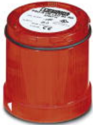
LED blinking light element, 24 V AC/DC, red

Please be informed that the data shown in this PDF Document is generated from our Online Catalog. Please find the complete data in the user's documentation. Our General Terms of Use for Downloads are valid ( http://phoenixcontact.com/download )