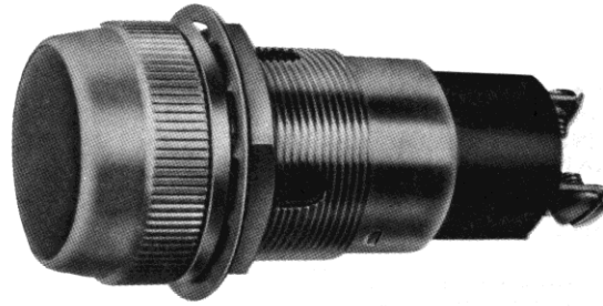
104-3101-0211-403 Flat lens