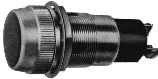
104-3101-0211-403 Flat lens