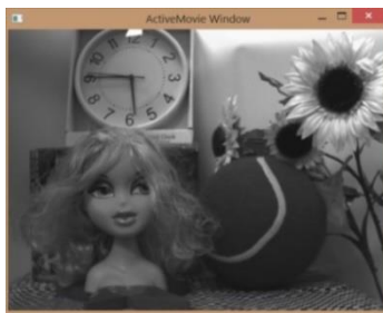
Camera Tool view mode