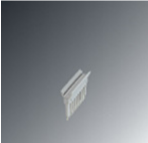
Plug-in bridge, Number of positions: 10, Color: red

Please be informed that the data shown in this PDF Document is generated from our Online Catalog. Please find the complete data in the user's documentation. Our General Terms of Use for Downloads are valid ( http://phoenixcontact.com/download )