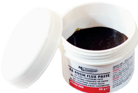
#8342-50G (50 g)

A RA Rosin Flux Paste superior electronic grade flux paste system that makes SMD electrical and electronics soldering faster and easier. It is designed for lead-free alloys, but it works well with conventional leaded solder. It is easy to apply and stays on the area where it is applied, and a little bit goes a long way. It does not contain any Zinc Chloride or Ammonium Chloride. Post soldering residues removal is much easier due to the organic acid base of the flux.