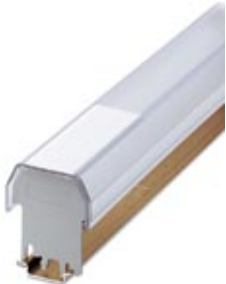
Insert strip, white, unlabeled, Mounting type: Insert, Lettering field: 35 x 500 mm

Please be informed that the data shown in this PDF Document is generated from our Online Catalog. Please find the complete data in the user's documentation. Our General Terms of Use for Downloads are valid ( http://phoenixcontact.com/download )