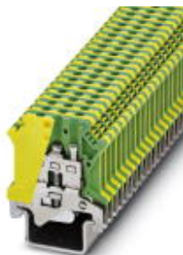
Ground modular terminal block, Connection method: Screw connection, Cross section: 0.2 mm 2 - 4 mm 2 , AWG 24 - 12, Width: 6.2 mm, Color: green-yellow, Mounting type: NS 35/15-2,3

Please be informed that the data shown in this PDF Document is generated from our Online Catalog. Please find the complete data in the user's documentation. Our General Terms of Use for Downloads are valid ( http://download.phoenixcontact.com )