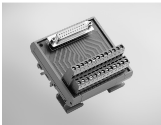
ADAM-3925 DB25 DIN-rail Wiring Board

PCI-1735U, PCL-711B, PCL-720+, PCL-726, PCL-727, PCL-730, PCL-812PG, PCL-816, PCL-818 Series, PCL-836