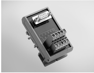
ADAM-3909 DB9 DIN-rail Wiring Board