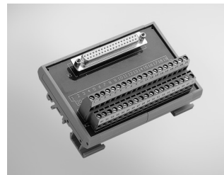
ADAM-3937 DB37 DIN-rail Wiring Board