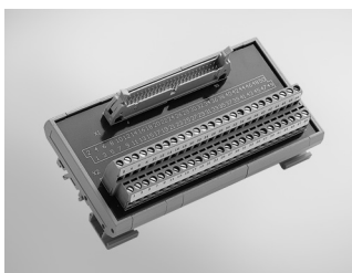
ADAM-3950 50-pin DIN-rail Flat Cable Wiring Board

PCI-1713U, PCI-1715U, PCI-1718HDU, PCI-1720U, PCI-1730U, PCI-1733, PCI-1734, PCI-1750, PCI-1760U, PCI-1761