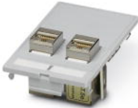
Illustration shows the product version VS-SI-FP-2RJ45-5-MOD-BU/BU

Front plate with contact inserts, plastic, 2x D-SUB 9, socket/pin