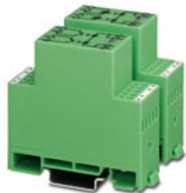
Power solid-state relay, for S0 meter interfaces, output: 15 - 120 V DC

Please be informed that the data shown in this PDF Document is generated from our Online Catalog. Please find the complete data in the user's documentation. Our General Terms of Use for Downloads are valid ( http://phoenixcontact.com/download )