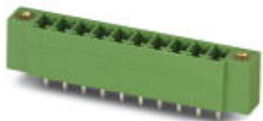
The figure shows a 10-position version of the product

PCB headers, nominal current: 8 A, number of positions: 2, pitch: 3.81 mm, color: red, contact surface: Tin, mounting: Wave soldering