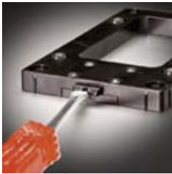
Snap-on device with spring loaded latch