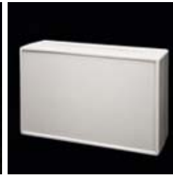
The entire front can be used for mounting keypads, switches, displays etc.