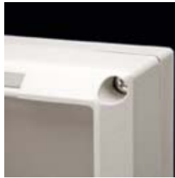
The lid fastening screws are located on the backside of the base