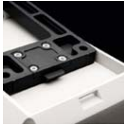
A recess on the bottom of the enclosure locates the snap-on device (invisible from the front)