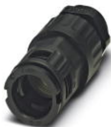
Cable gland, Pg thread, IP68/69k protection, with strain relief

Please be informed that the data shown in this PDF Document is generated from our Online Catalog. Please find the complete data in the user's documentation. Our General Terms of Use for Downloads are valid ( http://phoenixcontact.com/download )