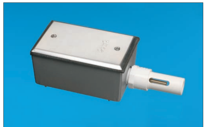
Outdoor Air Sensor with Weatherproof Box