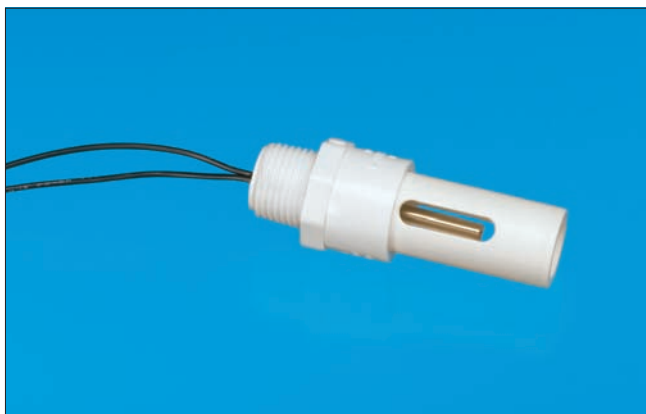
Standard Outdoor Air Temperature Sensor

Standard temp accuracy is \pm 0.2^\circ\text{C} from 0^\circ\text{C} to 70^\circ\text{C} Resistance versus temperature information for material curve Z can be found on page 59.