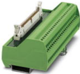
VARIOFACE interface module

Please be informed that the data shown in this PDF Document is generated from our Online Catalog. Please find the complete data in the user's documentation. Our General Terms of Use for Downloads are valid ( http://phoenixcontact.com/download )