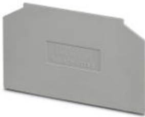
Partition plate, Length: 69 mm, Width: 1.5 mm, Height: 57 mm, Color: gray

Please be informed that the data shown in this PDF Document is generated from our Online Catalog. Please find the complete data in the user's documentation. Our General Terms of Use for Downloads are valid ( http://download.phoenixcontact.com )