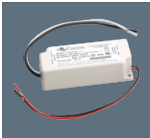
Class 2 Power Supply 12W Califa Lighting Part # - PS-1032

PRODUCT DETAILS For hardwiring with track systems, this Power Supply is best Suited for use with single track segments with lower wattage luminaires.