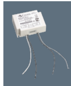
Class 2 Power Supply 40W Califa Lighting Part # - PS-1033

PRODUCT DETAILS For hardwiring with track systems, this Power Supply is best suited for use with multiple track segments with higher wattage luminaires.