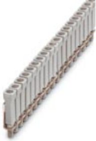
Jumper, Number of positions: 100, Color: gray

Please be informed that the data shown in this PDF Document is generated from our Online Catalog. Please find the complete data in the user's documentation. Our General Terms of Use for Downloads are valid ( http://download.phoenixcontact.com )