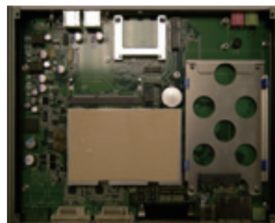
» Fanless Design