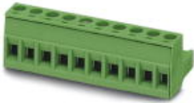
The figure shows a 10-pos. version of the product in green

PCB connector, nominal current: 12 A, number of positions: 4, pitch: 5 mm, connection method: Screw connection with tension sleeve, color: blue, contact surface: Tin