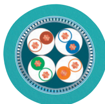
Cable cross section