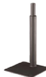
Model: 960-09 Mount Stand, 9" (203.2mm)

Click on any of the above images to find out more about the products pictured.