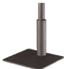
Model: 960-06 Mount Stand, 6" (127mm)