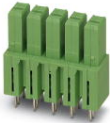
PCB headers, nominal current: 41 A, number of positions: 7, pitch: 7.62 mm, color: gray, contact surface: Tin, mounting: Wave soldering

Please be informed that the data shown in this PDF Document is generated from our Online Catalog. Please find the complete data in the user's documentation. Our General Terms of Use for Downloads are valid ( http://phoenixcontact.com/download )