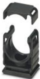
Hose holder with cover

Please be informed that the data shown in this PDF Document is generated from our Online Catalog. Please find the complete data in the user's documentation. Our General Terms of Use for Downloads are valid ( http://phoenixcontact.com/download )