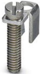
Chain bridge, Number of positions: 1, Color: silver

Please be informed that the data shown in this PDF Document is generated from our Online Catalog. Please find the complete data in the user's documentation. Our General Terms of Use for Downloads are valid ( http://download.phoenixcontact.com )