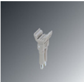
Plug-in bridge, Number of positions: 2, Color: red

Please be informed that the data shown in this PDF Document is generated from our Online Catalog. Please find the complete data in the user's documentation. Our General Terms of Use for Downloads are valid ( http://phoenixcontact.com/download )