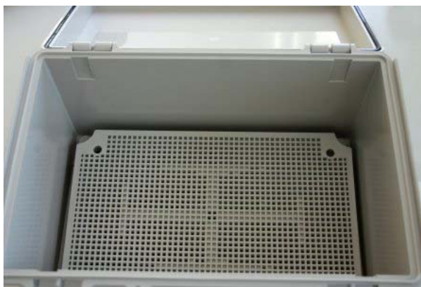
Click on Image for Larger View

An all plastic accessory panel used with the NBF series NEMA boxes that allows easy mounting of electronic devices in the box