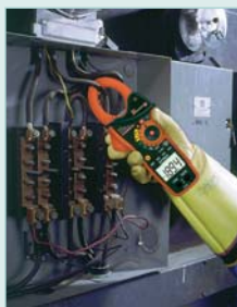
CAT IV -600V safety rating for added protection and True RMS feature gives you accurate readings of non-sinusoidal waveforms.