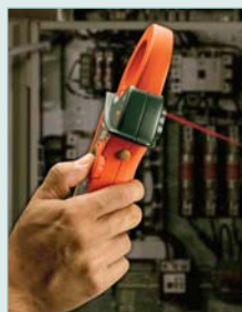
Built-in IR Thermometer with laser pointer is an excellent troubleshooter for locating hot spots and overheating motors.