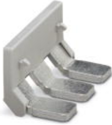
Insertion bridge, Number of positions: 3, Color: gray

Please be informed that the data shown in this PDF Document is generated from our Online Catalog. Please find the complete data in the user's documentation. Our General Terms of Use for Downloads are valid ( http://download.phoenixcontact.com )