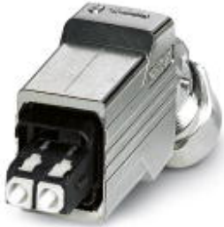
Push-pull connector (version 14), die-cast zinc, with SC-RJ insert for GOF, for cable diameter of 5.5 mm ... 10 mm, cable outlet at the bottom, 10 pcs.

Please be informed that the data shown in this PDF Document is generated from our Online Catalog. Please find the complete data in the user's documentation. Our General Terms of Use for Downloads are valid ( http://phoenixcontact.com/download )