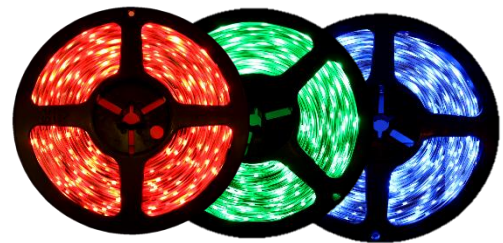
Red Green Blue Available in NB & SB Only NB, SB & UB Only