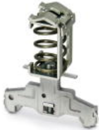
Shield connection terminal block, for applying the shield to busbars

Please be informed that the data shown in this PDF Document is generated from our Online Catalog. Please find the complete data in the user's documentation. Our General Terms of Use for Downloads are valid ( http://download.phoenixcontact.com )