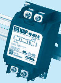
DIN rail installation type is option